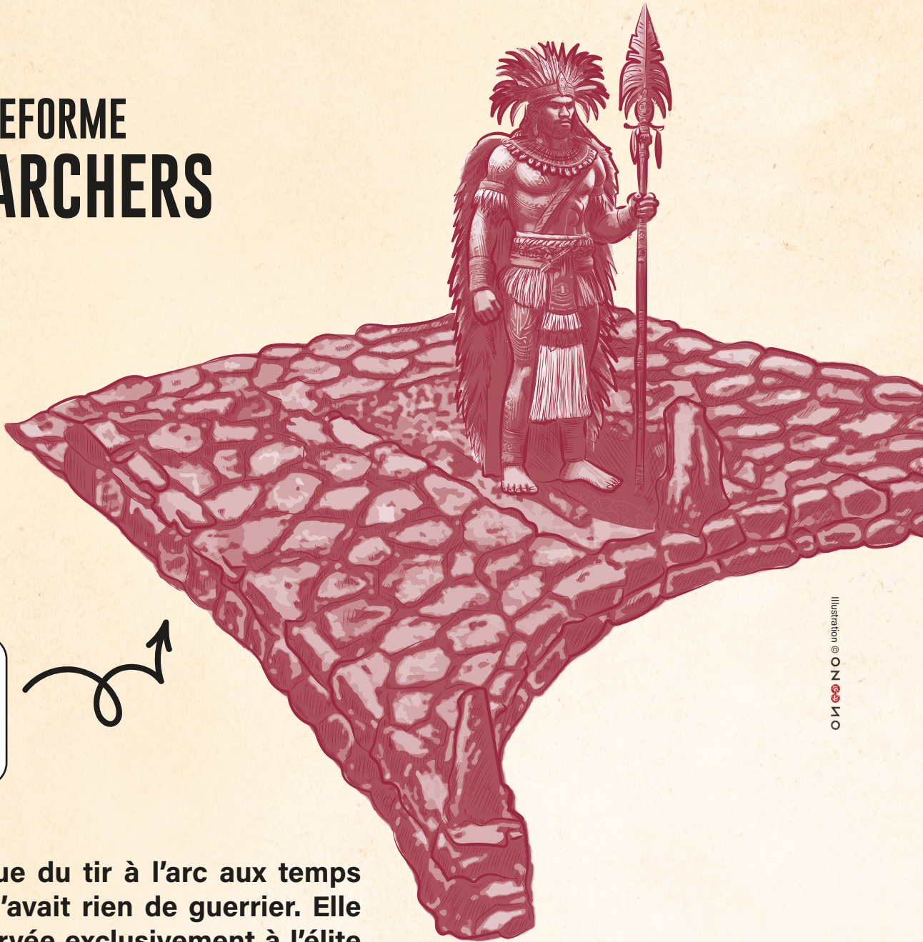
Illustration © ONO MO