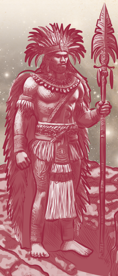
Illustration © ONO IHO